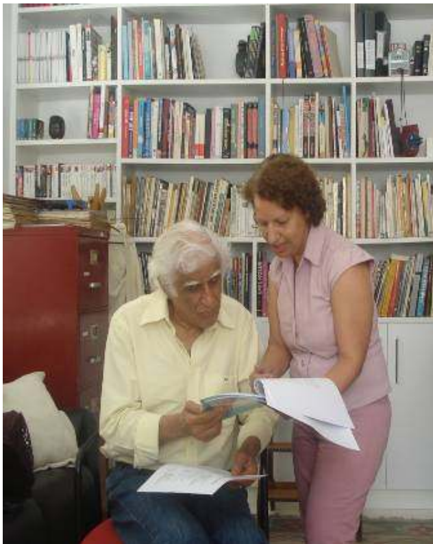
ZIRALDO, CONHECENDO O PROJETO AEL, EM SEU ESTÚDIO, NO RIO DE JANEIRO. ACEITOU O CONVITE E NOS HONROU COM A SUA PRESENÇA NA FUNDAÇÃO DA AEL ZIRALDO 2010