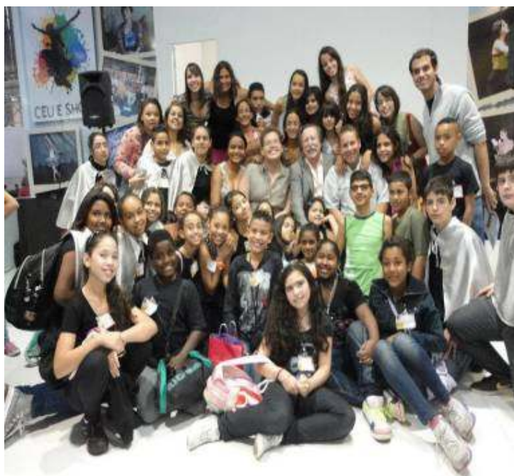
AEL PEDRO BANDEIRA, NA BIENAL DO LIVRO, NO ESTANDE DA SME, NO ANHEMBI, SP, EM 2012. AO CENTRO, O PATRONO DA ACADEMIA, O ESCRITOR PEDRO BANDEIRA, APÓS TER ASSISTIDO À ENCENAÇÃO DE “COMO CONQUISTAR ESSA GAROTA”, PELOS ALUNOS ACADÊMICOS, ADAPTADA DO SEU LIVRO E DIRIGIDA PELA PROFESSORA DE TEATRO DA AEL