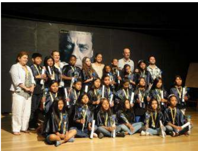
FUNDAÇÃO DA AEL CHICO BUARQUE DE HOLLANDA DIRETORIA REGIONAL DE EDUCAÇÃO PENHA (SP) 2012