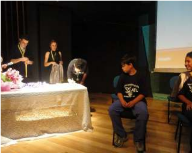
FUNDAÇÃO DA AEL RICARDO AZEVEDO DIRETORIA REGIONAL DE EDUCAÇÃO PENHA (SP) – 2012