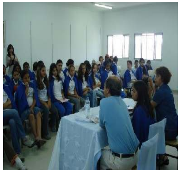
ENCONTRO COM ESCRITORES NA AEL