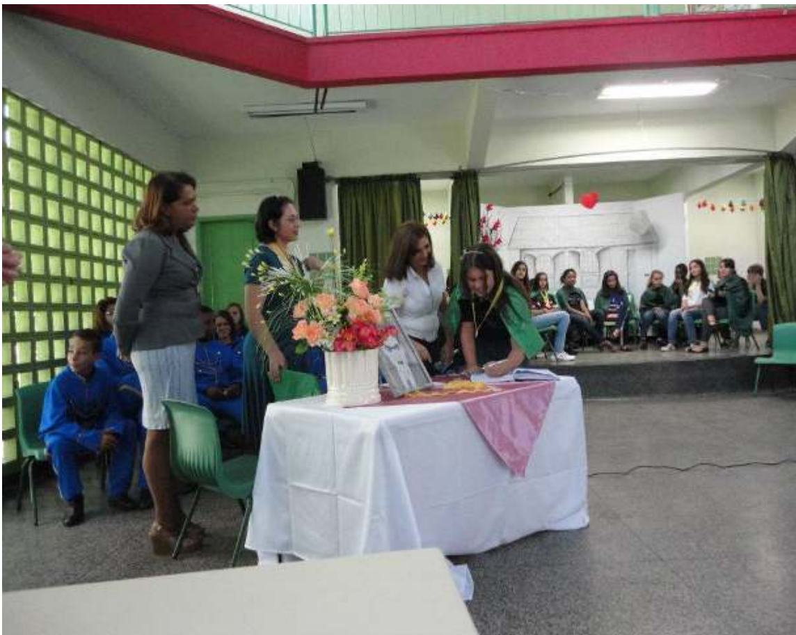
FESTA ANUAL DE POSSE – AEL MONTEIRO LOBATO DIRETORIA REGIONAL DE EDUCAÇÃO PENHA (SP)