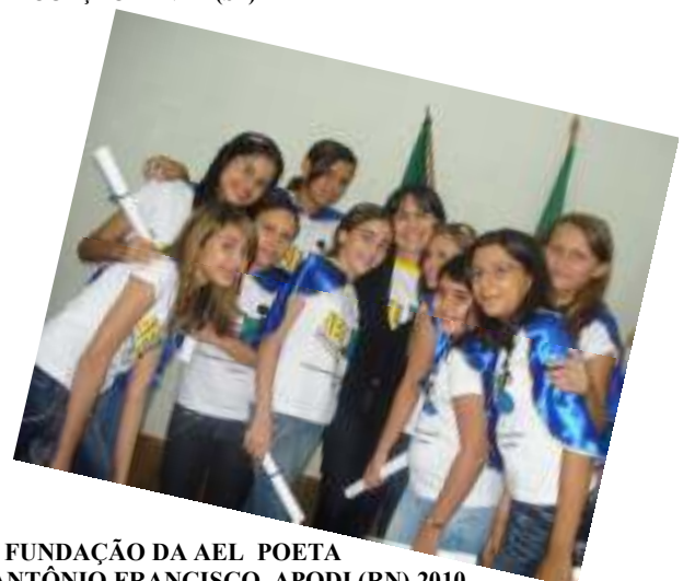
FUNDAÇÃO DA AEL POETA ANTÔNIO FRANCISCO APODI (RN) 2010