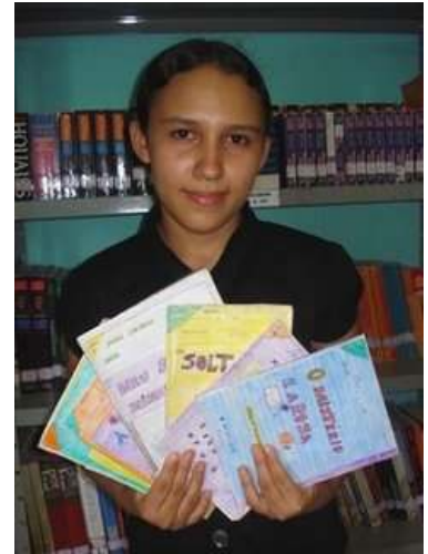
MARINA E OS LIVROS PRODUZIDOS POR ELA MESMA AEL ANTÔNIO FRANCISCO APODI (RN)