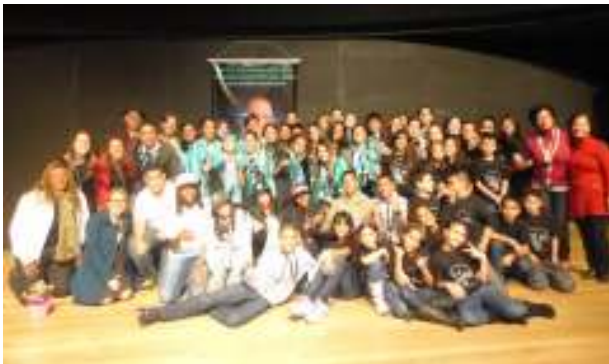
FUNDAÇÃO DA AEL ANA MARIA MACHADO 2012 DIRETORIA REGIONAL DE EDUCAÇÃO PENHA (SP)

FUNDAÇÃO DA 1ª ACADEMIA: AEL PADRE ANTÔNIO VIEIRA DIRETORIA REGIONAL DE EDUCAÇÃO PENHA – SP 2005 JORNAL O ESTADO DE SÃO PAULO