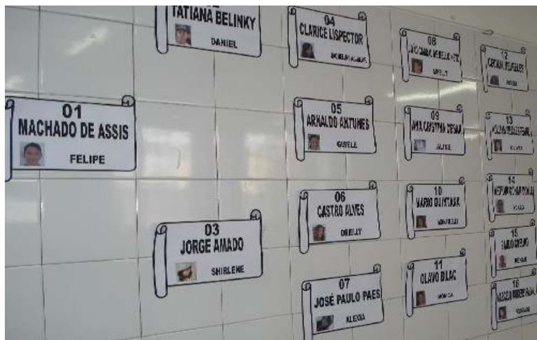
MARCA DOS IMORTAIS – AEL MACHADO DE ASSIS (SP)