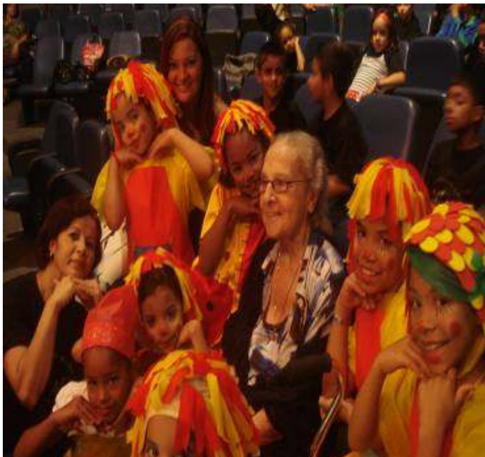
PRESENÇA DA ESCRITORA NA FUNDAÇÃO DA AEL TATIANA BELINKY: “VOCÊS SÃO VERDADEIRAMENTE ACADÊMICOS!”2010